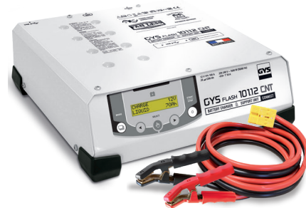
Зажимы в наборе (5 м - 16 мм 2 )