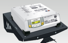
Полка с настенным креплением 055513