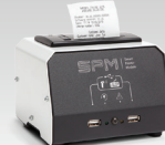
SPM : Блок принтера 026919