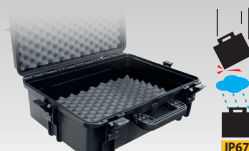
Кейс для транспортировки 060432